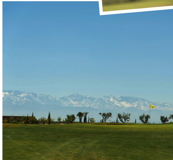
Imposante Kulisse in Marokko: Im Februar stehen zwei Turniere in Marrakesch auf dem Plan der Pro Golf Tour.

Auch Moritz Lampert aus dem Golf Team Germany hat für die Belek-Turniere in der Türkei gemeldet.