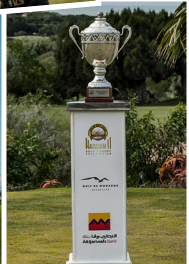
Um diesen Siegerpokal geht es bei der Open Mogador in Marokko.